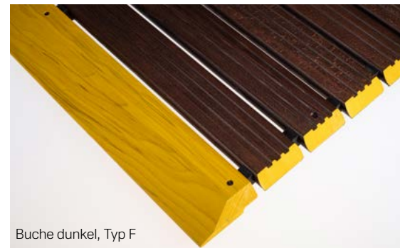
Buche dunkel, Typ F