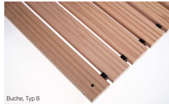
Buche, Typ B