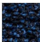
bleu *article de fin de série