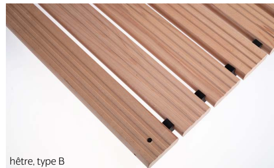
hêtre, type B