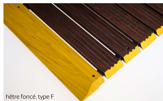
hêtre foncé, type F