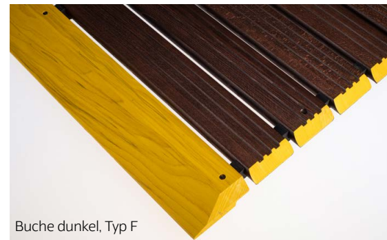
Buche dunkel, Typ F