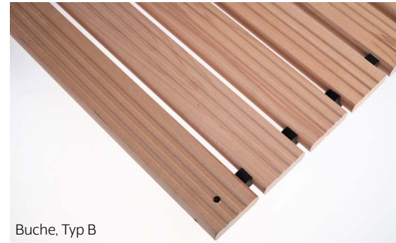
Buche, Typ B